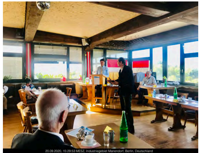
20.09.2020, 15:29:53 MESZ, Industriegebiet Mariendorf, Berlin, Deutschland