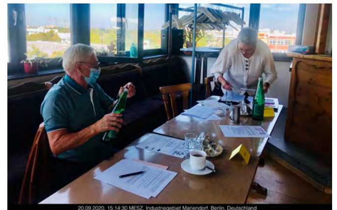
20.09.2020, 15:14:30 MESZ, Industriegebiet Mariendorf, Berlin, Deutschland